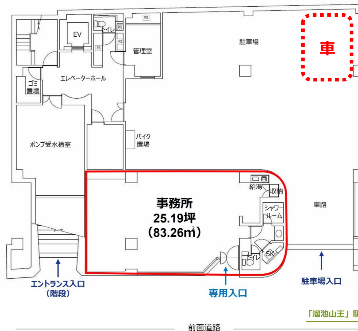
【地下1階】専用入口ご案内