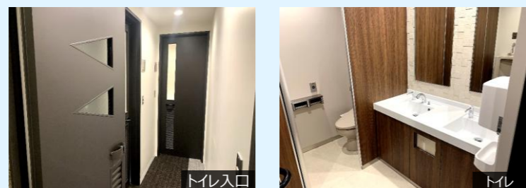
※EVホール・トイレ リニューアル済（2021年）