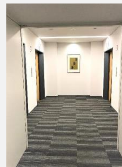
▲EVホール・共用廊下