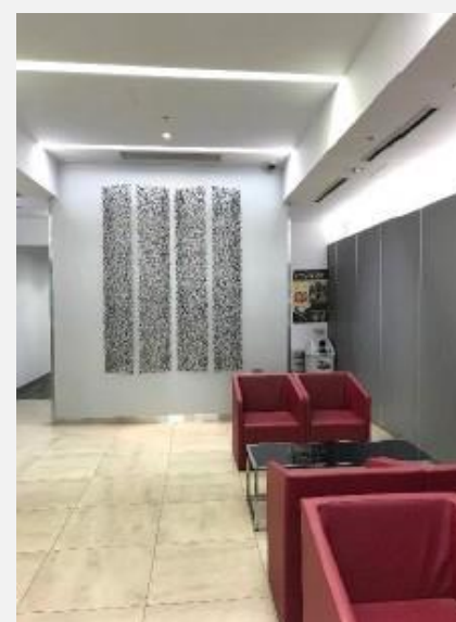
▲エントランスホール