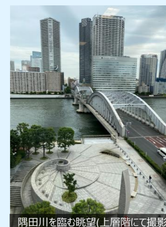
隅田川を臨む眺望(上層階にて撮影)